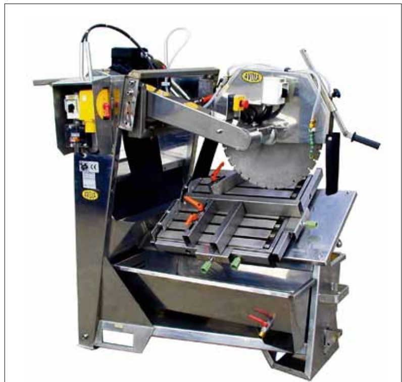
AVOLA-Stein-Trennsäge STS/N – Nassschnitt.