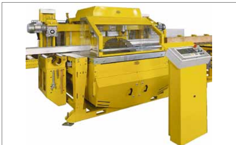
AVOLA-Zimmereikreissäge Gama 80 V 4 mit automatischer Be- und Entladung.

→ AVOLA stellt auf der bauma in der Halle A1 Stand Nr. 339 seine neuesten Produkte vor und hat anlässlich des 180-jährigen Jubiläums tolle Aktionen im Gepäck.