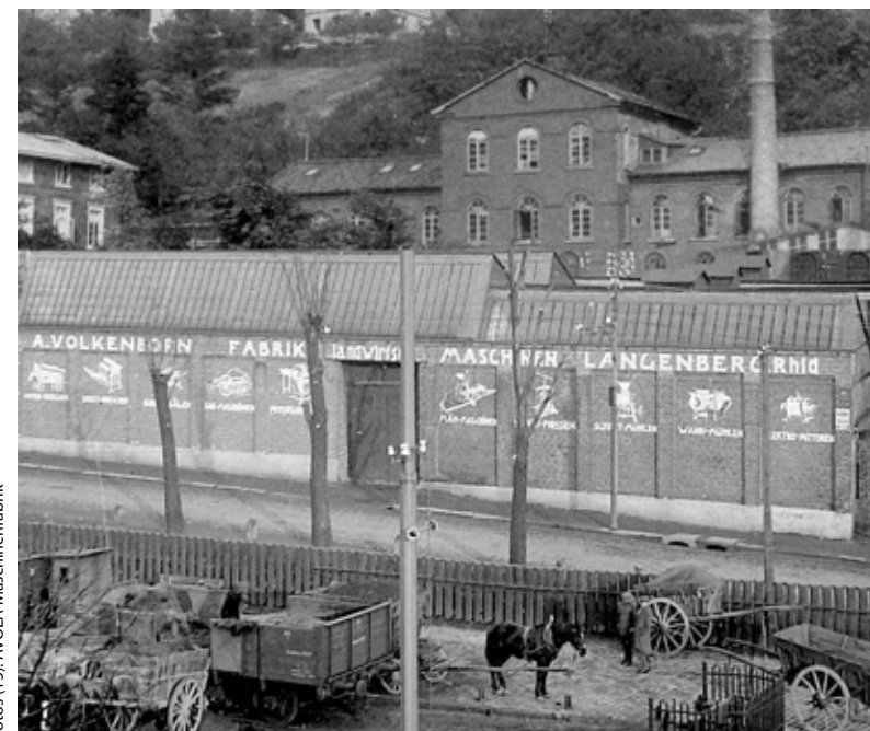
AVOLA – erstes Firmengebäude.