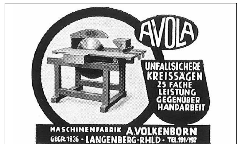
Historische AVOLA-Werbung zur unfallsicheren Kreissäge.