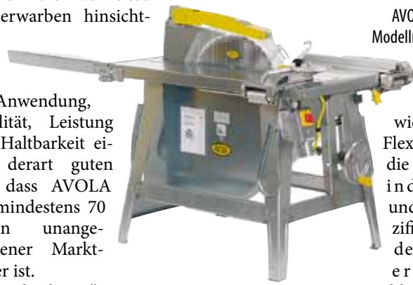
AVOLA-Baukreissäge, Modellreihe ZBV 500-10.

lich Anwendung, Stabilität, Leistung und Haltbarkeit einen derart guten Ruf, dass AVOLA seit mindestens 70 Jahren unangefochtener Marktführer ist.