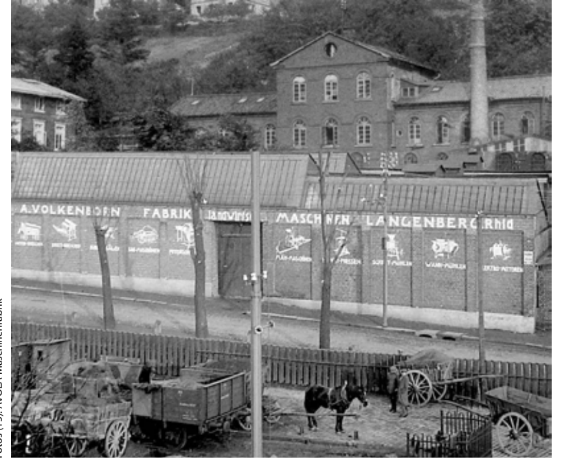
AVOLA – erstes Firmengebäude.