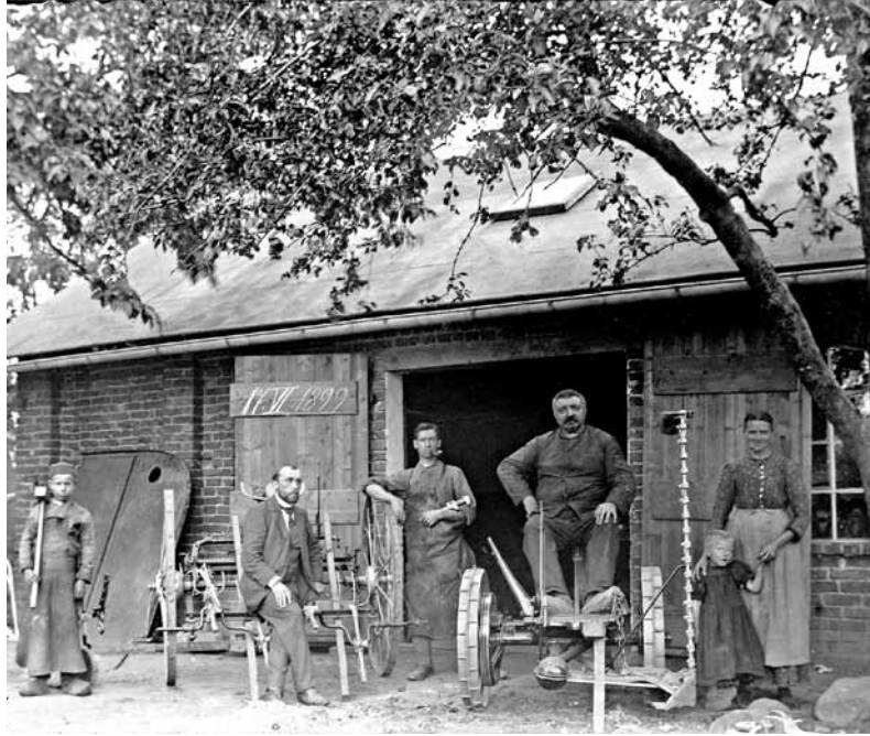
AVOLA-Außenfertigung im Jahr 1899.