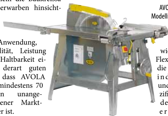
AVOLA-Baukreissäge, Modellreihe ZBV 500-10.

lich Anwendung, Stabilität, Leistung und Haltbarkeit einen derart guten Ruf, dass AVOLA seit mindestens 70 Jahren unangefochtener Marktführer ist.